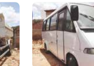
Microonibus IVECO 2004 - Bola Veículos (84) 3431 - 1379 | 9963 - 1051