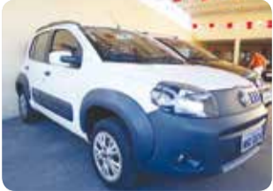
Uno Way 1.0 completo 2011/2012 - Marcellos's (84) 3431 - 2368 | 9657 - 6767 8897 - 4988