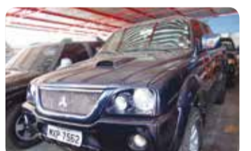
L-200 2006 completa - Bola Veículos (84) 3431 - 1379 | 9963 - 1051