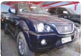
L200 3.0 CRV 2006 completa - Bola Veículos (84) 3431 - 1379 | 9963 - 1051