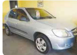
Prisma Max com AR e DH 2007/2008 - Marcellos's (84) 3431 - 2368 | 9657 - 6767 | 8897 - 4988