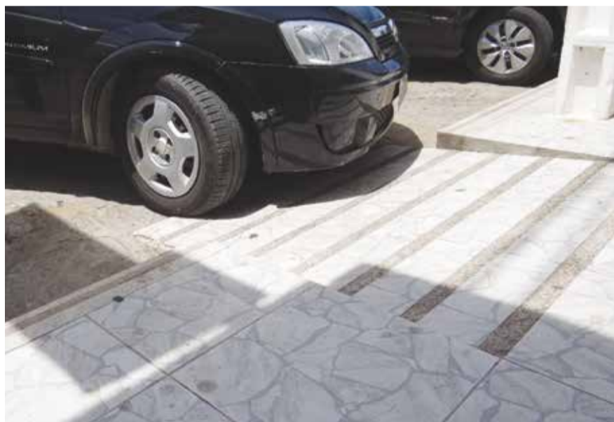
Veículos estacionam em frente as rampas de acessibilidade.

Há 14 anos foram criadas duas importantes leis para quem necessita de acessibilidade, a Lei nº 10.048, que dá prioridade de atendimento às pessoas que a regulamentação especifica, e a Lei nº 10.098, que estabelece normas gerais e critérios básicos para a promoção da acessibilidade. Já em