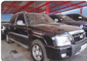
S-10 executiva 2011 - Bola Veículos (84) 3431 - 1379 | 9963 - 1051