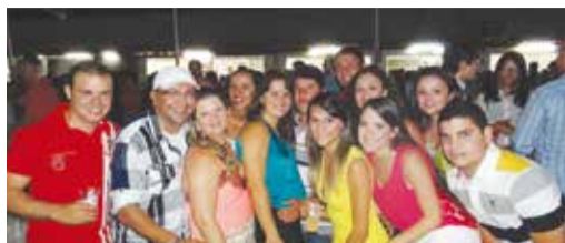
A turma da Destak Confeções esteve junta e se confraternizou no Forró das Antigas, nos 6 Anos do Pulsação.