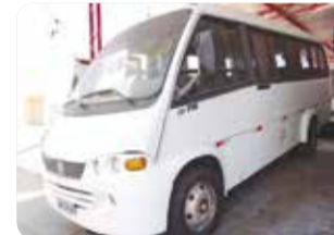
Microonibus 2001 - Bola Veículos (84) 3431 - 1379 | 9963 - 1051