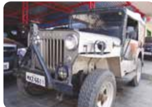
Jeep 1954 motor opala 4 cilindros - Bola Veículos (84) 3431 - 1379 | 9963 - 1051