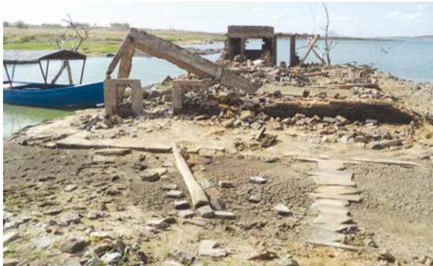
A barragem Armando Ribeiro Gonçalves abastece hoje 34 municípios do RN.

Isso é assustador, visto que o reservatório tem a responsabilidade de abastecer pelo menos 34 cidades da região, todos os dias através do sistema de adutoras, e dispõe de uma capacidade de 2,4 bilhões de metros cúbicos. Além de tudo, a barragem