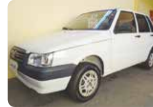
Uno Mile Economic 2008 / 2009 - Marcellos's (84) 3431 - 2368 | 9657 - 6767 | 8897 - 4988