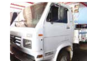
VW 7100 1999 - Bola Veículos (84) 3431 - 1379 | 9963 - 1051