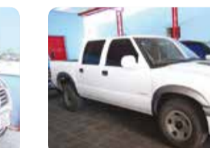
S-10 Colina 2006 completa - Bola Veícu- los (84) 3431 - 1379 | 9963 - 1051