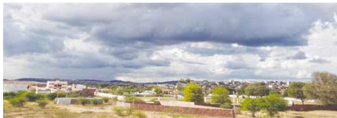
Na última segunda (13), o céu curraisnovense esteve nublado e choveu no fim da tarde.

CENÁRIO CLIMÁTICO ATUAL REVELA QUE O SEMIÁRIDO PODE SER PALCO DE BOAS CHUVAS NESTE ANO