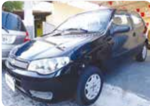
Pálio Fire 2p Econimic com AR 2009/2010 - Marcellos's (84) 3431 - 2368 | 9657 - 6767 | 8897 - 4988