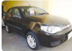
Siena Fire complete 2008/2009 - Marcellos's (84) 3431 - 2368 | 9657 - 6767 | 8897 - 4988