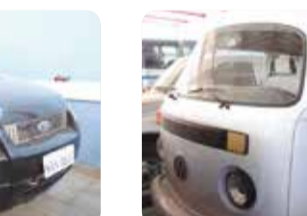
Kombi 2002 - Bola Veículos (84) 3431 - 1379 | 9963 - 1051