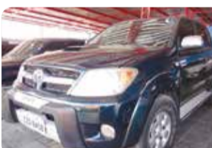
Hilux - Bola Veículos (84) 3431 - 1379 | 9963 - 1051