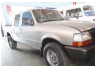
Ranger diesel 1999 completa - Bola Veícu- los (84) 3431 - 1379 | 9963 - 1051