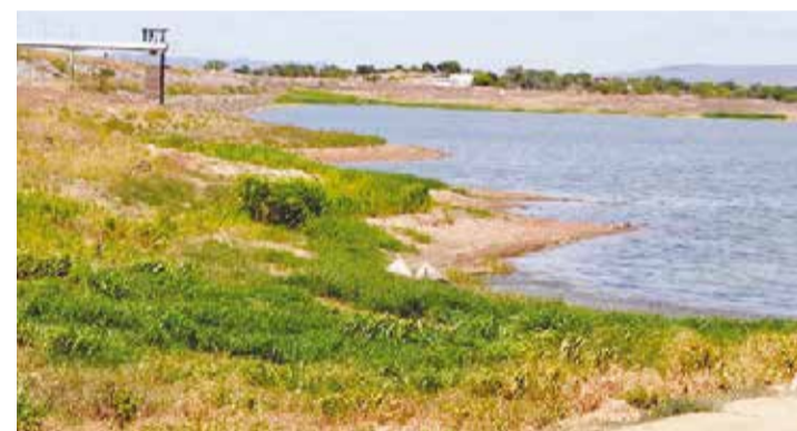
Imagem do açude Itans, localizado em Caicó/RN.

Faz-se possível verificar ainda que Currais Novos e São Fernando também apresentam os reservatórios com baixo índice de água, contudo, adutoras vizinhas suprem abastecimento. Tendo em vista esse panorama, uma adutora de engate rápido está sendo providenciada para atender Pau dos Ferros, que se encontra a beira do esgotamento. E ainda, três reservatórios estão com as comportas fechadas para amenizar a perda do líquido precioso, a água.