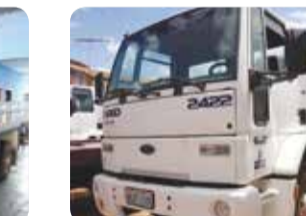
Ford Cargo Caçambão 2422 - 2004 - Bola Veículos (84) 3431 - 1379 | 9963 - 1051