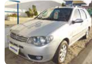
Pálio Weekend ELX completíssimo - Marcellos's (84) 3431 - 2368 | 9657 - 6767 | 8897 - 4988