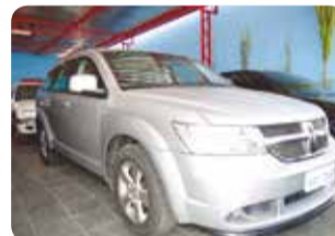
Dodge 2009 blindado - Bola Veículos (84) 3431 - 1379 | 9963 - 1051