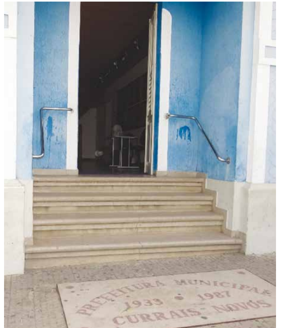
Prédio da Prefeitura de Currais Novos, sem acessibilidade.

2004, foi criado um programa do governo federal chamado “Brasil Acessível”, este que procura estimular governos municipais e estaduais a desenvolver medidas que garantam a transitabilidade para pessoas com algum tipo de restrição de mobilidade e deficiência nos sistemas de transporte, equipamentos urbanos e locomoção pública.