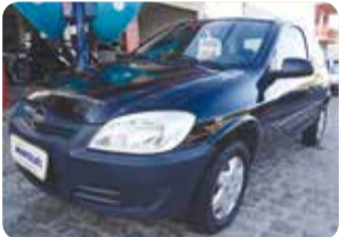
Celta Life 2p com AR, TR, AL, VD 2007/2008 - Marcellos's (84) 3431 - 2368 | 9657 - 6767 | 8897 - 4988