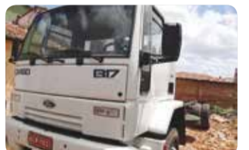
Ford Cargo 1317 - 2004 - Bola Veículos (84) 3431 - 1379 | 9963 - 1051

ALUGUE UM CARRO COM SEGURANÇA E COMODIDADE