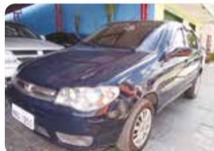
Siena 2011 completo - Bola Veículos (84) 3431 - 1379 | 9963 - 1051