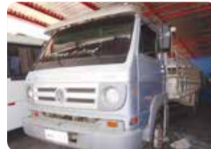
VW 8.150 2006 - Bola Veículos (84) 3431 - 1379 | 9963 - 1051