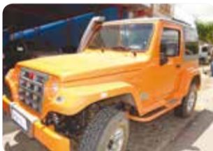
Troller 2013 completo - Bola Veículos (84) 3431 - 1379 | 9963 - 1051