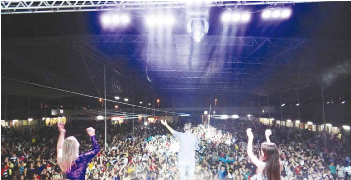
O Forró do Pulsação comemorou seu aniversário de 6 anos com o Forró das Antigas em Currais Novos