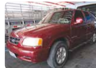
Blazer 1997 completa com GNV - Bola Veículos (84) 3431 - 1379 | 9963 - 1051