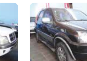
Eco Spot 4x4 2006 completo - Bola Veícu- los (84) 3431 - 1379 | 9963 - 1051