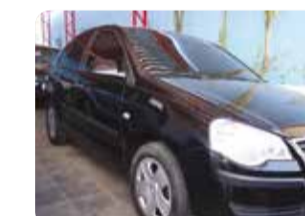
Polo 2006/2007 completo - Bola Veículos (84) 3431 - 1379 | 9963 - 1051