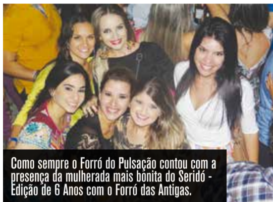
Como sempre o Forró do Pulsação contou com a presença da mulherada mais bonita do Seridó - Edição de 6 Anos com o Forró das Antigas.